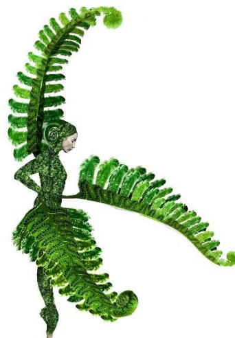
Paproć, projekt kostiumu: Anna Chadaj