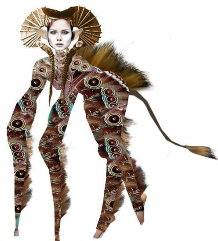
Zwierzę, projekt kostium: Anna Chadaj