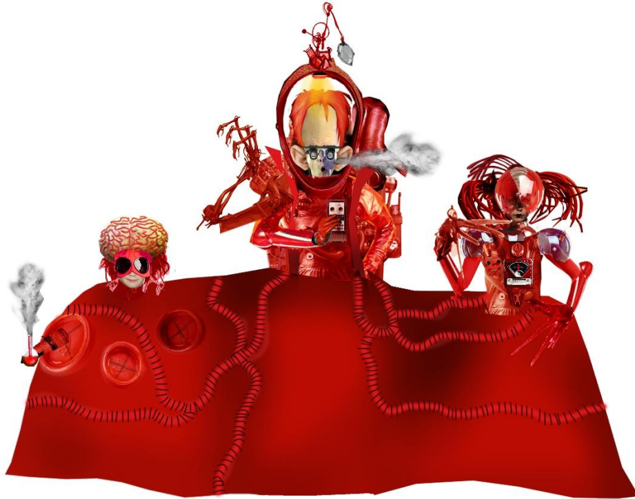
Harrat, projekt kostiumu: Anna Chadaj