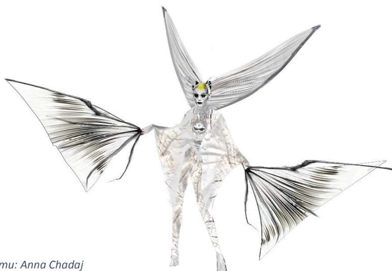
Sawora, projekt kostiumu: Anna Chadaj

Bardzo otyły i obślizgły, a zarazem niezwykle sympatyczny i szarmancki mieszkaniec podwodnej krainy, którego ogromną pasją jest taniec. Przyjaźnie nastawiony do świata i innych istot.