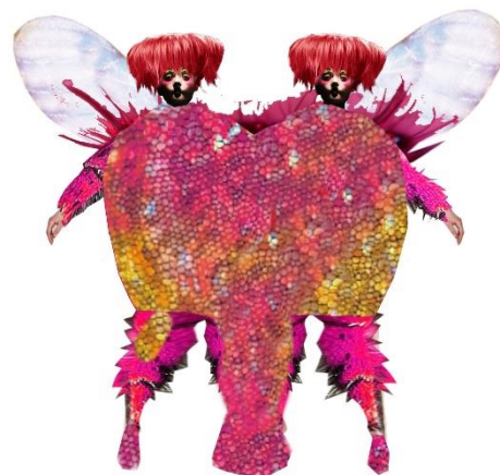
Gilgolak, projekt kostiumu: Anna Chadaj

* uczestnicy projektu edukacyjnego LAMAILA